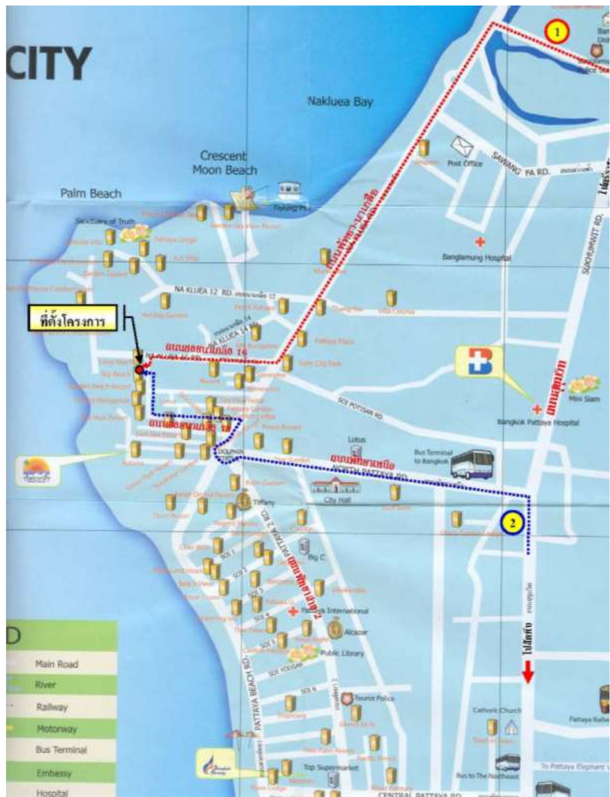
รูปที่ 1-1 แสดงที่ตั้งโครงการ